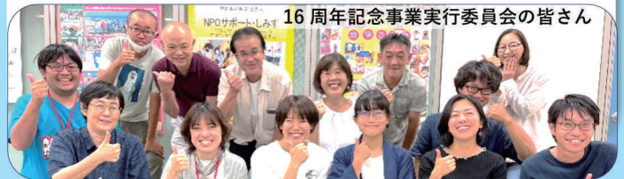
16周年記念事業実行委員会の皆さん

笑顔はつながりを強くするチカラ 笑顔は困難を乗り越えるチカラ 地域で頑張る団体の「とっておきの笑顔」を集めた写真展示です。